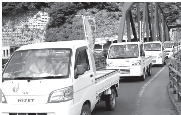
栄村での軽トラパレード